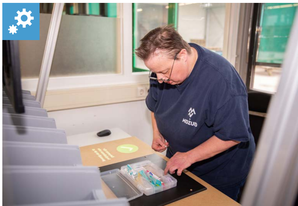
Tech for Inclusion – MidZuid