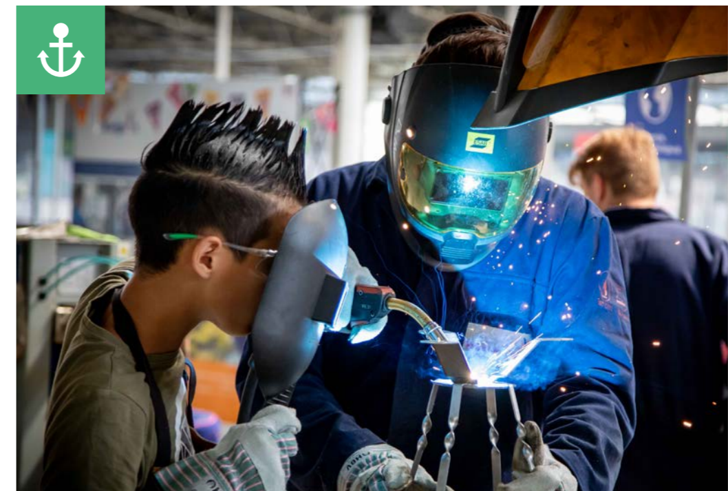
Game ON - FME