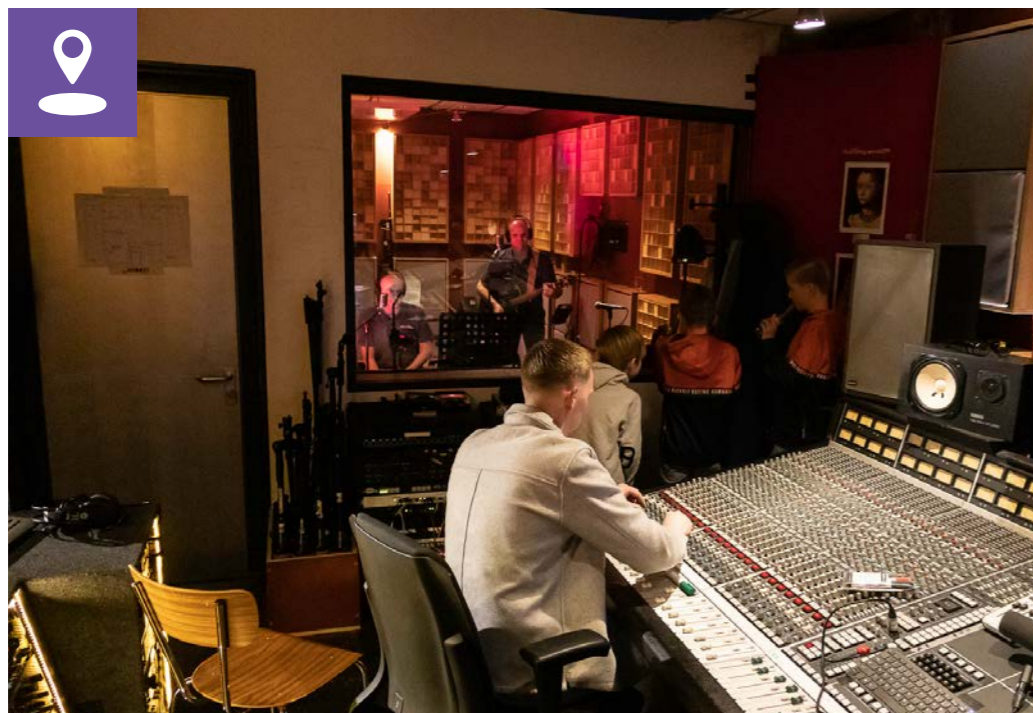
Creatieve dienstverlening Zuid-West Brabant – Gemeente Bergen op Zoom, Curio en bedrijfsleven