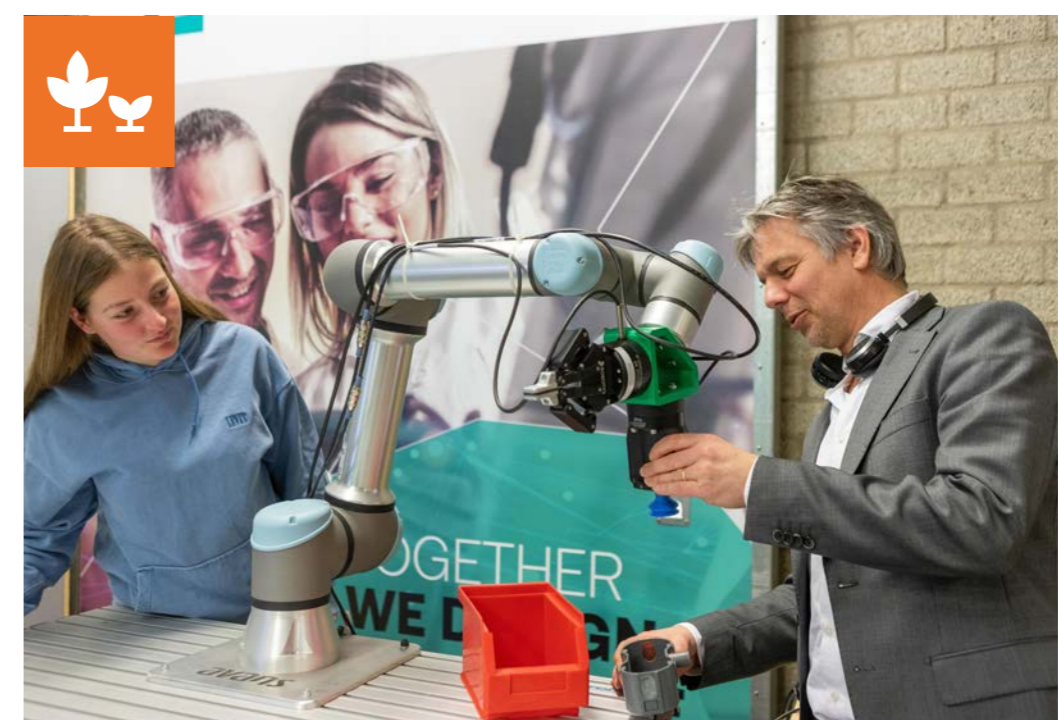
C Boost - Modoc Robots